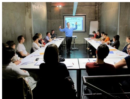
CC foto door Domus Medica